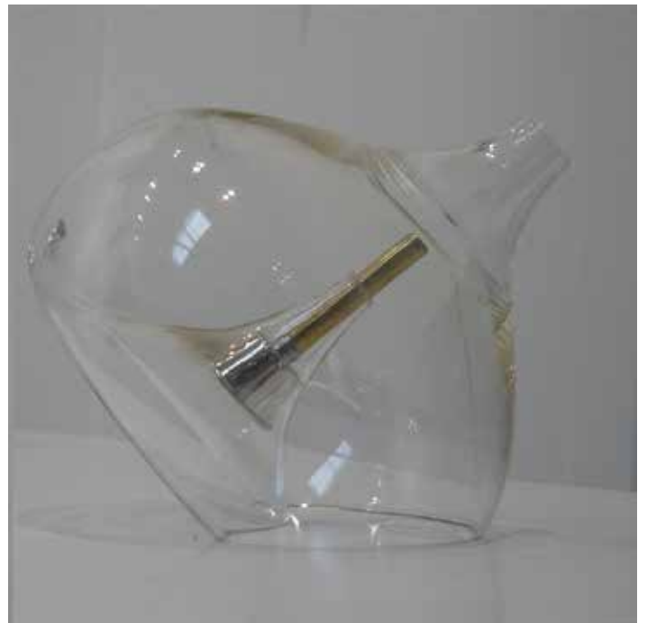
Big Wah Wah#002 / 2016