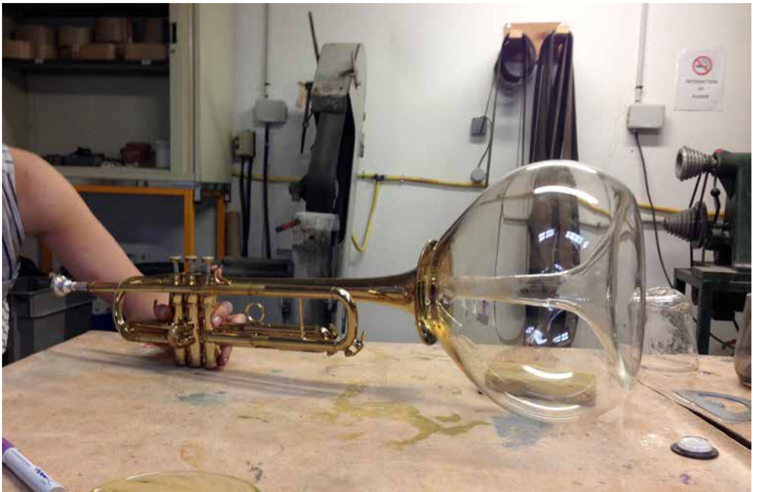
Big Wah Wah#001 / Images d'atelier Arcamglass / 2016